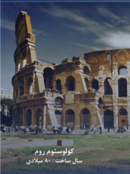
کولوسئوم روم سال ساخت: ۸۰ میلادی