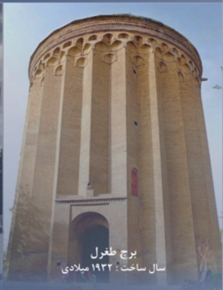
برج طغول سال ساخت: ۱۹۳۲ میلادی